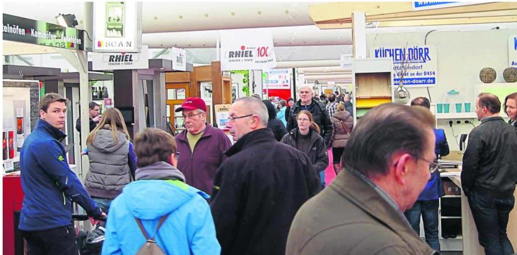
Rund 200 Anbieter sind angemeldet und präsentieren ihre Produkte und Dienstleistungen auf über 170 Ständen. Auch in puncto Branchenvielfalt kann sich die Memo-Bauen sehen lassen. Weit über 600 Brancheneinträge umfasst das diesjährige Angebot.