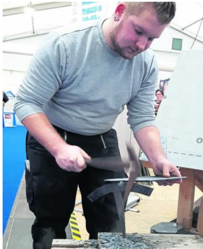
Auch das Dachdeckerhandwerk ist auf der Memo-Bauen vom 31. Januar bis 3. Februar in Marburg vertreten.