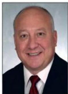
R. Klippert Facharzt für Chirurgie ARTHROSKOPEUR (AGA)

Hüfte Totalendoprothesen mit Stiel und Oberflächenersatz - Mc Minn, Kurzschaftprothese