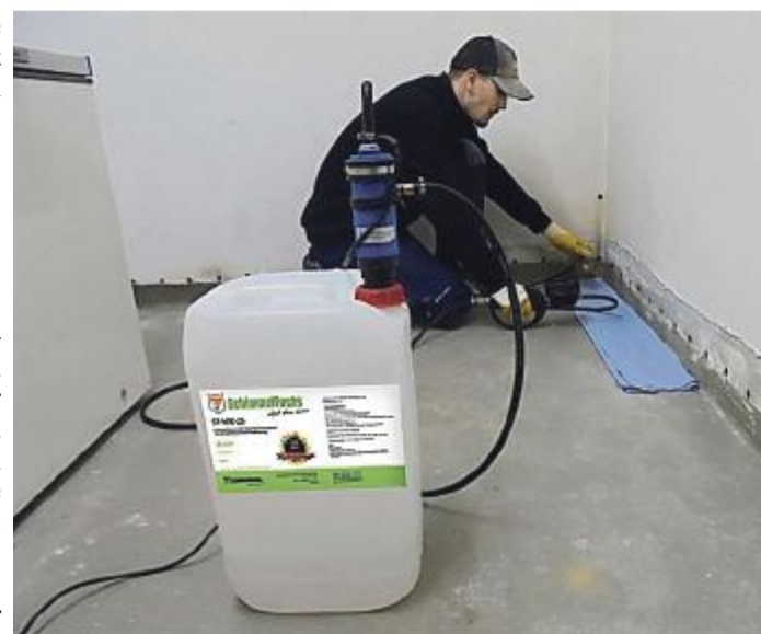
Dank des innovativen Produktes ist keine Ausschachtung nötig.

Das neue Angebot der Stadtwerke Marburg wendet sich an alle Hauseigentümer: Mit einer gepachteten Solaranlage sparen sie vom ersten Sonnenstrahl an – ganz ohne Aufwand. Weitere Informationen gibt es auf: https://stadtwerke-marburg.de/produkte/strom/sonnendach/ oder am Stand auf der Memo-Bauen in Halle 1 an Stand 107.