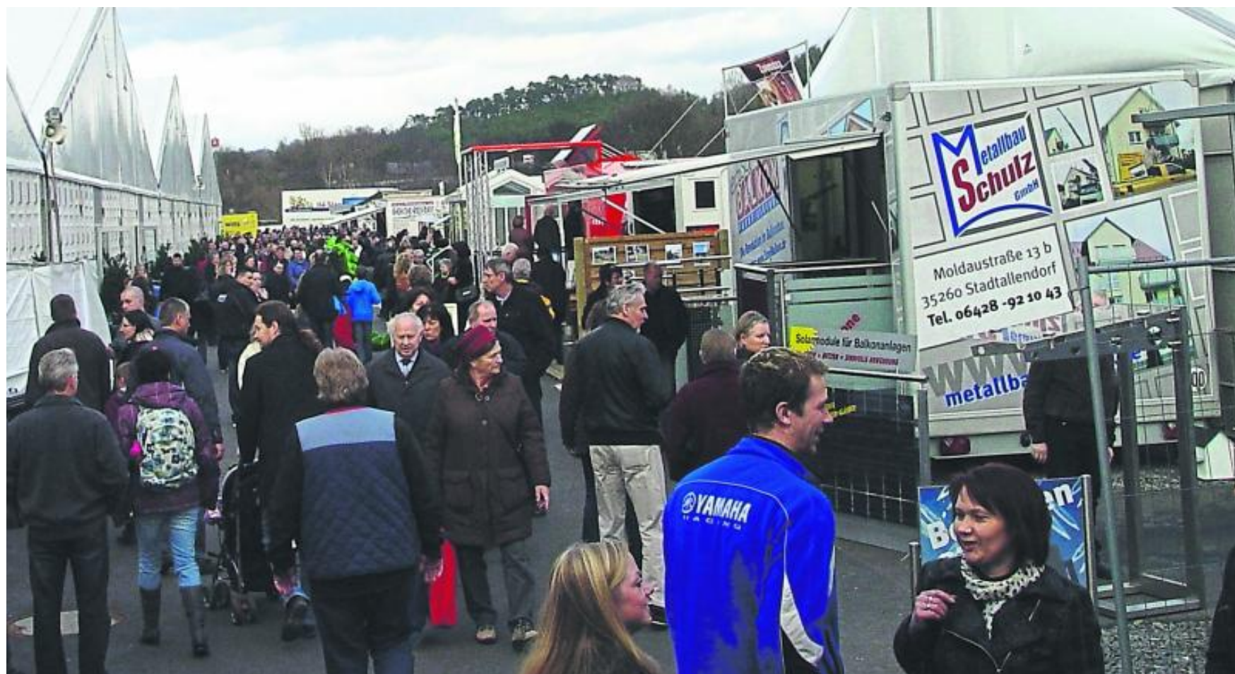
Auch auf dem Außengelände der Memo-Bauen tummeln sich immer viele Besucher auf dem Weg in die einzelnen Messehallen.

Das messeeigene Sonderthema „Energie“ unterstützt der Fachdienst KLEE, indem er über aktuelle Förderprogramme und Aktionen rund um Klimaschutz und Nachhaltigkeit informiert. Zum Beispiel fördern der Landkreis und die Sparkasse Marburg-Biedenkopf ab 2019 Bürger, Vereine und kleine Unternehmen im Bereich Elektromobilität. Bis zu 100 Ladepunkte werden dann von Privatpersonen, Vereinen und kleinen Unternehmen durch einen Zuschuss gefördert. Der Kauf und die Installation einer Ladestation für Elektroautos wird mit 400 Euro bezuschusst. Dieser Betrag kann sich auf insgesamt 500 Euro erhöhen, wenn Strom aus Erneuerbaren Energien vor Ort produziert wird, etwa mit einer eigenen Photovoltaikanlage.